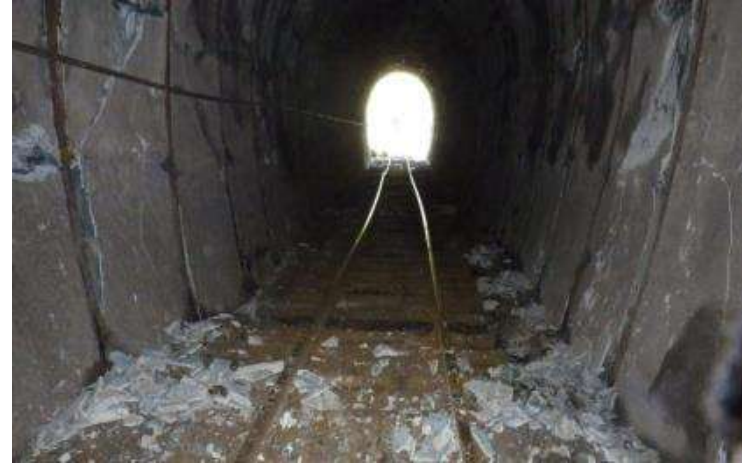
犀角山トンネル内亀裂多数