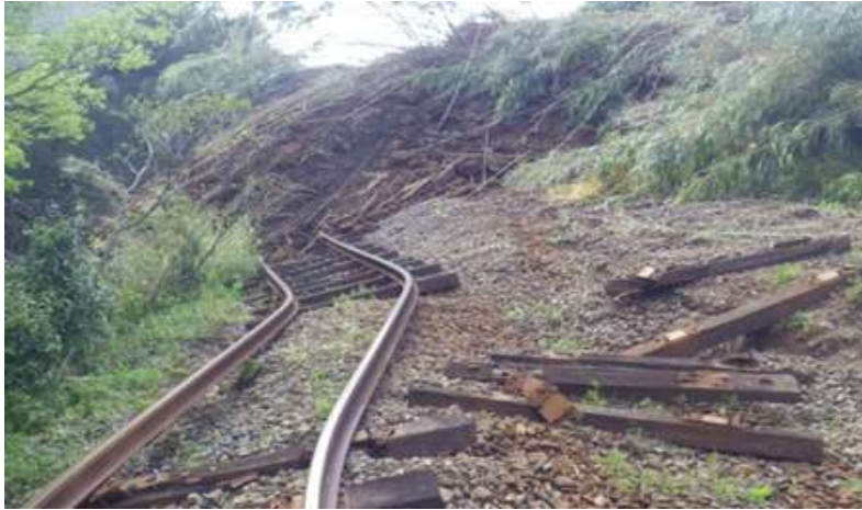
土砂流入終点側・激しい変状 立野駅から1k300m付近～延長約250m